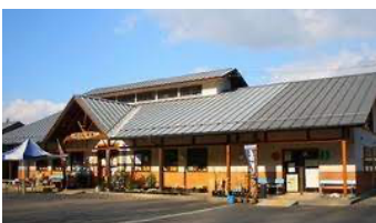
道の駅たまかわ こぶしの里

実証試験にご参加いただいた方（中学生以上・見学者含む）に対し、下記施設で利用できるクーポンを進呈しております。尚、ご利用方法等につきましては、配布時にスタッフから詳しいご説明をさせていただきます。